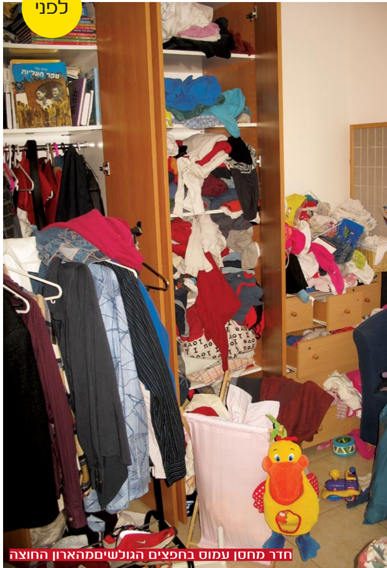
חדר מחסן עמוס בחפצים הגולשים מהארון החוצה