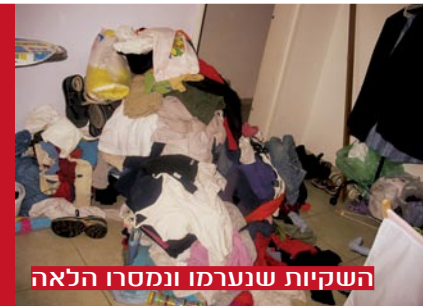
השקיות שנערמו ונמסרו הלאה