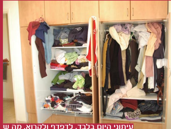
עיתוני היום בלבד, לדפדף ולקרוא. מה ש

מומלץ להשקיע במיטה נוחה ובמצעים משובחים. עדיף לקנות שני סטים טובים ויפים למיטה, גם אם הם יקרים, מאשר חמישה סטים זולים. אחת לשנה, למשל בפסח או בראש השנה, אפשר להוסיף סט חדש למבחר. בסך הכל אין צורך ביותר מארבעה סטים מושלמים למיטה.