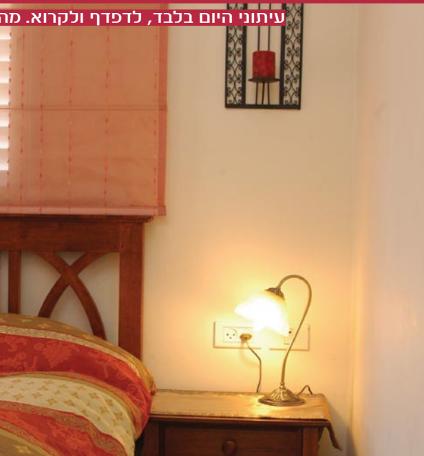
עיתוני היום בלבד, לדפדף ולקרוא. מה ש