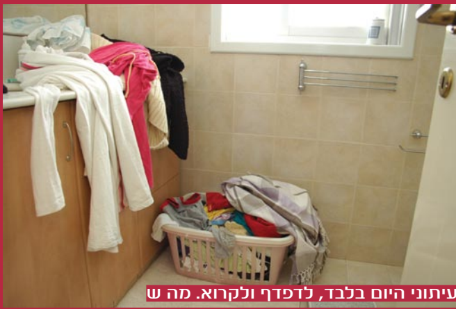
עיתוני היום בלבד, לדפדף ולקרוא. מה ש