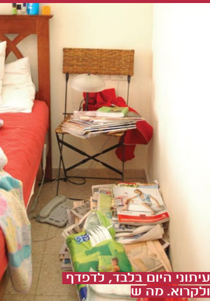
עיתוני היום בלבד, לדפדף ולקרוא. מה ש