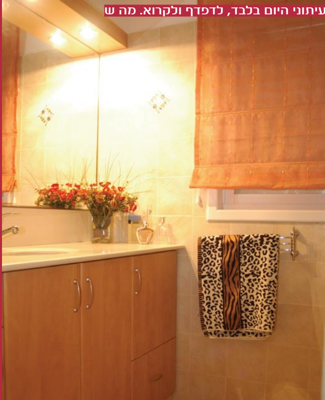
עיתוני היום בלבד, לדפדף ולקרוא. מה ש