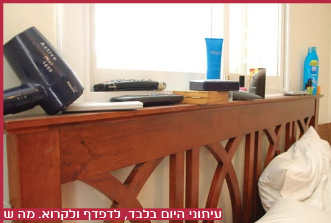
עיתוני היום בלבד, לדפדף ולקרוא. מה ש

מגבות המרקות על המיטה הן מראה שכיח בבתים רבים. הבעיה היא שאחרי יממה הן מתחילות להסריח (מוכר לכם?), מה שמצריך כביסה נוספת. מומלץ לארגן מקום קבוע ומאוורר לתליית מגבות. למשל, מתלה כביסה במרפסת או בכל מקום נוח אחר. אפשרות נוספת היא להכניס את כל המגבות הרטובות בסוף היום למיבש ואז לקפלן מחדש.