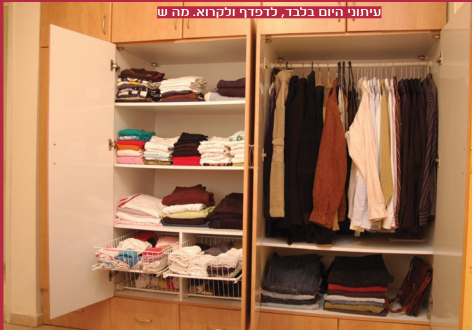
עיתוני היום בלבד, לדפדף ולקרוא. מה ש